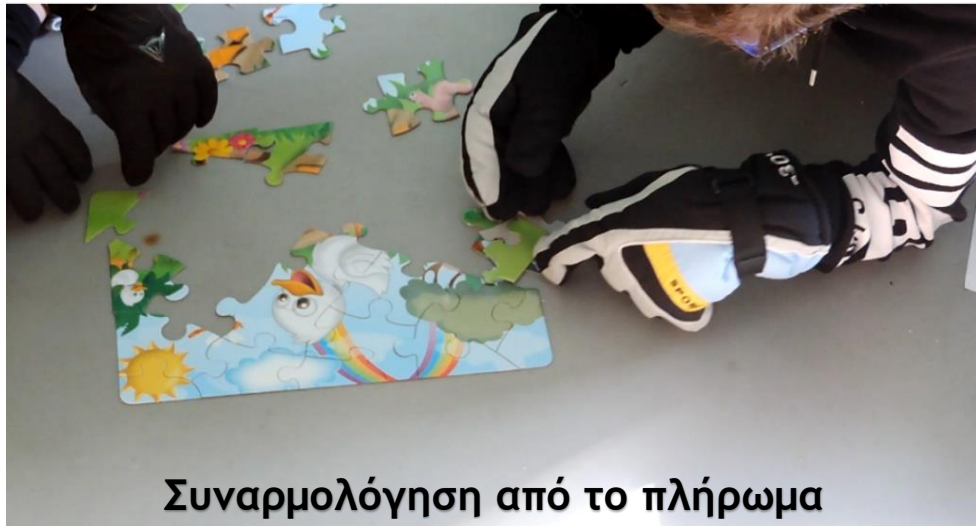
Συναρμολόγηση από το πλήρωμα